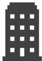
나 업체 주식회사 제O