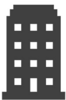
가 업체 OO건설