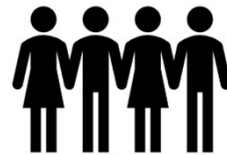
전직 고위공무원 A씨 가족 (2018년 퇴직)